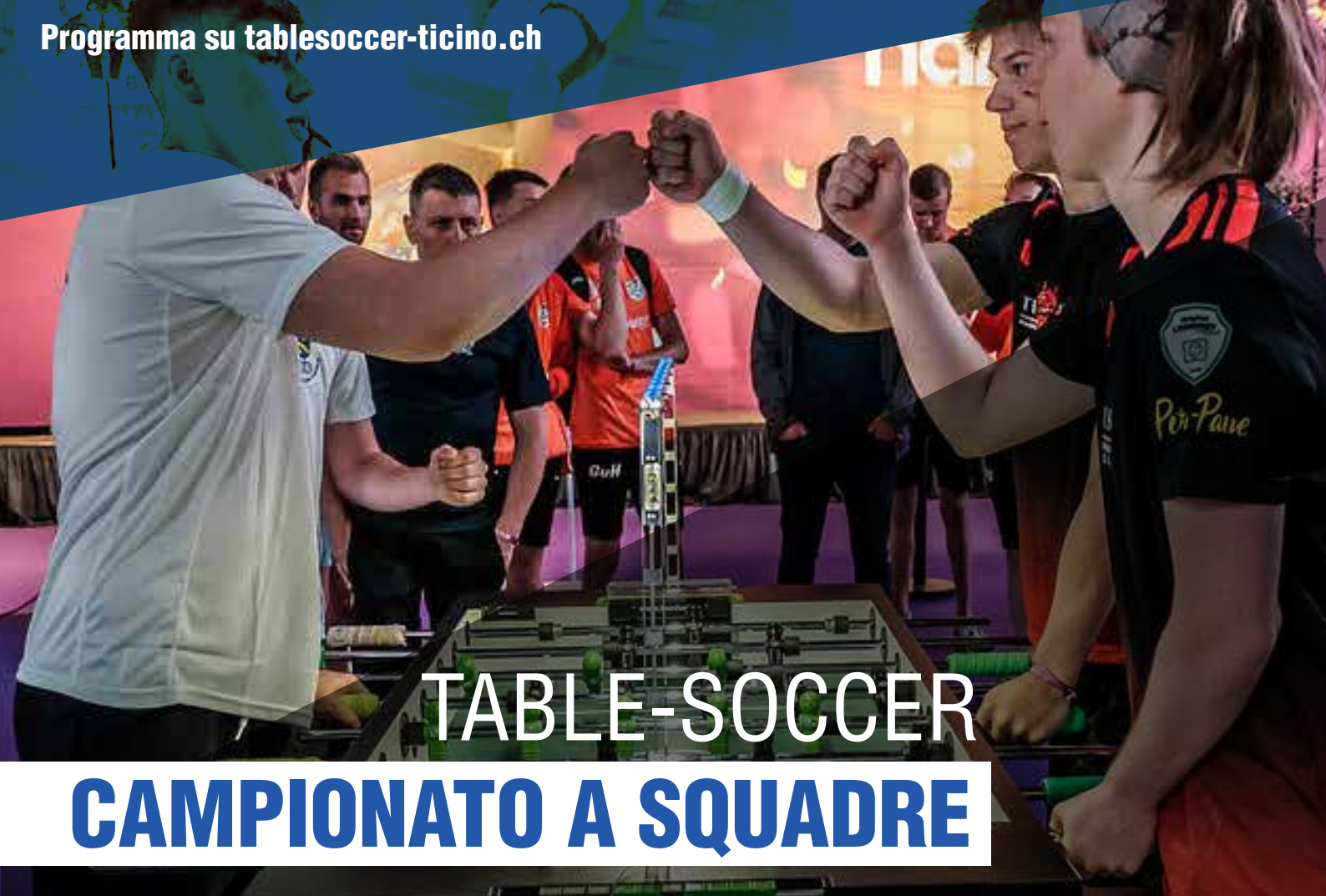
TABLE-SOCCER CAMPIONATO A SQUADRE