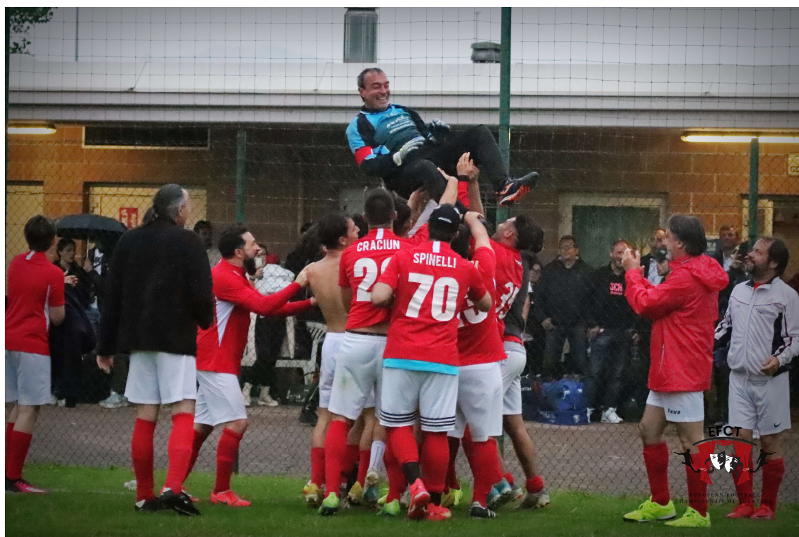
I giocatori del Teatro alla Scala festeggiano la vittoria nell'ultima edizione del Campionato a Vicenza.