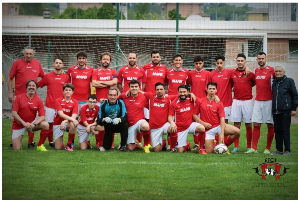
La formazione del Teatro alla Scala Campione d'Europa nel 2023.

Débute à l'EM 5 à Zurich en 1974. Parmi les participants, c'est celle qui vante le plus grand numéro de présences, 40 en total. Elle compte une série de 35 participations consécutives, de 1986 jusqu'à aujourd'hui. Elle a gagné le titre de Championne d'Europe à l'EM 33 et à l'EM 52 à Milan. Classée en 2 ème place à l'EM 34 à Krefeld et à l'EM 37 à Medulin.